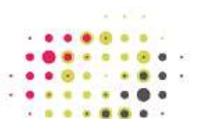
OdA GS Aargau Fördert Gesundheits- und Sozialberufe

oda soziales Bern Zentrum für Sozialberufe